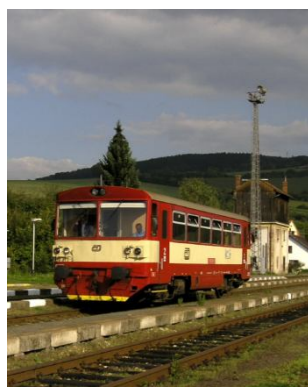
Pod kameny u světelné lampy na nádraží v Bylnici