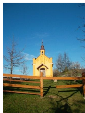
V areálu kaple sv. Anny u levého rohu