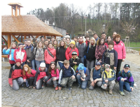
Foto celé výpravy