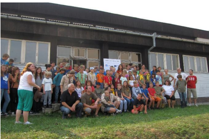
Výprava mladší generace

Dne 2. září 201 se na Vláře konalo setkání skautek a skautů z Brumova-Bylnice, Štítné nad Vlárí a Horného Srní a Nemšové. Původně se celá akce měla konat na samotné hranici mezi ČR a SK, kde mají tá-