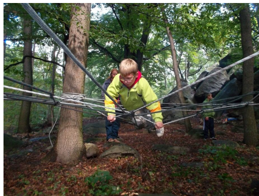
Jeden z úkolů