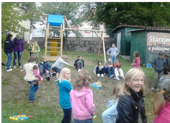
Zahájení skautského roku

hých prázdninách, znovu utužení přátelských vztahů a seznámení se s novými členy naší skautské rodiny.