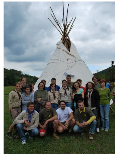
Výprava z Brumova

společné aktivity, workshopy a přednášky, diskuze a bohatý program, to vše i s mírnou jazykovou bariérou či věkovým rozdílem. Nabitý víkend se spoustou zážitků. Společný skautský duch a přátelská atmosféra se vedli celou akcí ruku v ruce s novými zkušenostmi a navázání nových kontaktů. Možná, že tato akce byla počátkem nové mezinárodní spolupráce, či nové tradice – mezinárodního setkávání na hranici.