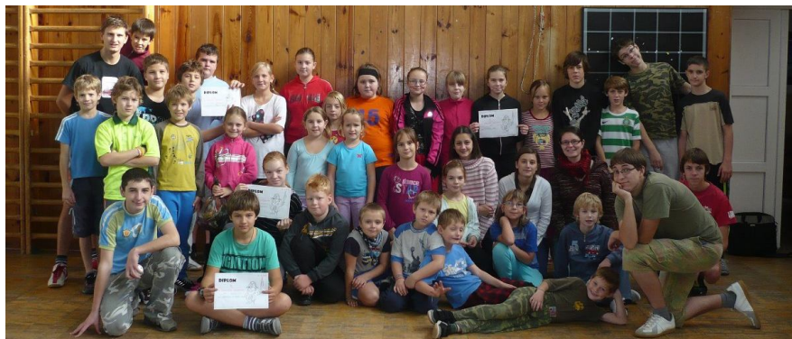
Společná fotografie ze Sportovního dne