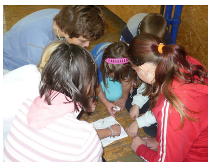
Skládání tajné mapy

tajného ostrova, zapamatovat si cestu k pokladu, hbitě zvládnout nástrahy džungle a opičí dráhy nebo například nakrmit hladového aligátora. Vyzkoušeli si také pašeráctví jednotlivých materiálů pro stavbu lodí či velký souboj o vyšší hodnoty. Na závěr nechybělo ani klasické měření síly v podobě štafet či barevné bitvy. Poté se hladoví mořeplavci pořádně na-