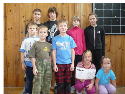
Vítězný pirátský tým

hlavně zábavy si všichni odnesli nejen drobné odměny, ale hlavně dobrý pocit z pohybu a dne strá-