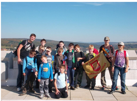
Z oddílové výpravy vlčat

pohled může zdát rozlišení složité, opak je pravdou=). Každá organizace by měla mít jasnou strukturu, která pomáhá k dosažení cílů. A jak to tedy vypadá u nás?