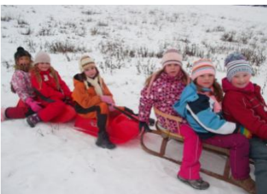
Pampelišky na sněhu :)

Naše družinka světlušek zahájila činnost v říjnu 2013. Všechny členky chodí do druhé třídy a scházíme se každý pátek v Malence. Nejraději ze všeho hrajeme hry. Snažíme se také naučit něco nového a k tomu nám slouží Nováček, kde se dovídáme nové věci o skautingu, přírodě a naší