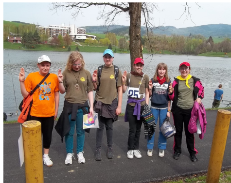
Při soutěžní disciplíně