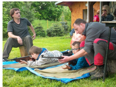
Střelba ze vzduchovky

Kdo ještě vydržel, ten si mohl u táboráku zazpívat při kytáře. Zkrátka příjemný i když trochu chladný den naplněný skautskou atmosférou.