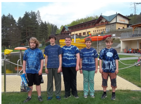
Postupující družina skautů

Tam se jim už bohužel nepodařilo probíjet mezi šťastné hlídky postupující do kola celostátního. I tak ale moc a moc gratulujeme a jsme rádi, že nás naši svěřenci tak výborně reprezentují.