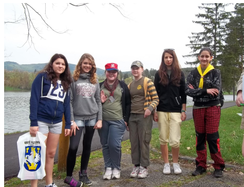
Dívčí družina při závodu