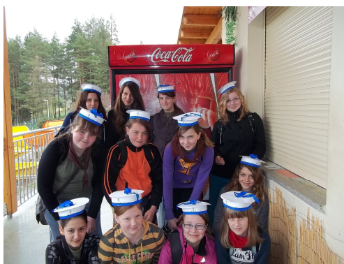
Brusinky jako námořníci