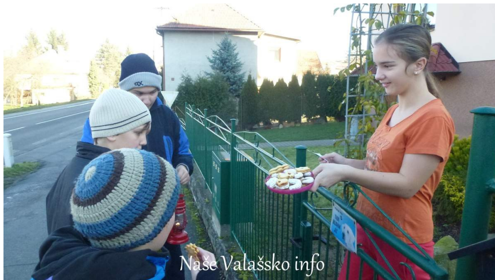
Naše Valašsko info