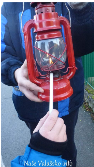
Naše Valašsko info

Přesně na Štědrý den, jsme tak jako každý rok, roznášeli do všech domácností Betlémské světlo, které k nám v sobotu 20. prosince 2014 přivezli brněňští skauti.