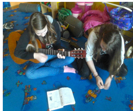
Jak naše skautky hrají a zpívají... (škoda jen, že měsíčník neumožňuje audio verzi:))

dy, dělali vánoční scénky. Za každý splněný úkol jsme dostali obě skupinky kus žluté hvězdy který jsme lepili na bílou hvězdu, a body. Večer jsme měli noční hru která nás dovedla k cíli – ke kostelu kde jsme donesli Třem Králům celou hvězdu a tím jsme obnovili kouzlo Vánoc. Ráno, po snídani jsme uklidili Malenku a zahráli jsme si Mafii a zazpívali si při kytarě.