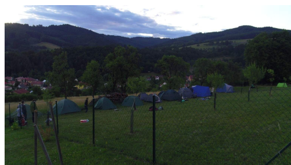
Stany kam se podíváš...