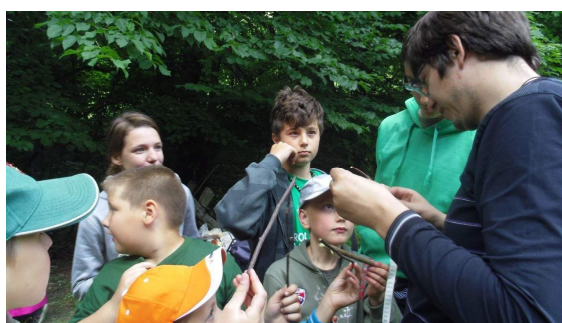
Kdo najde přesně 20 cm dlouhou paličku?