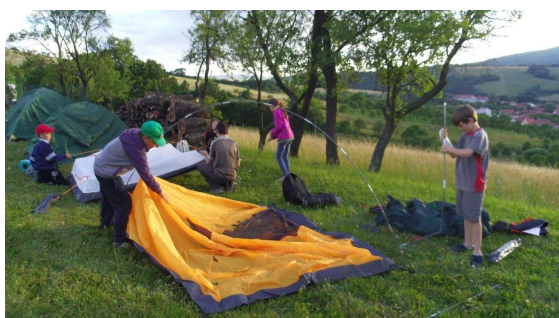
Stavba stanu dá pořádně zabrat!